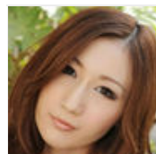
10种最适合冬季吃的蔬菜