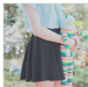
世事繁华,原来做好自己就好