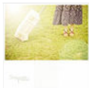
平淡生活里,总有一些遇见会让